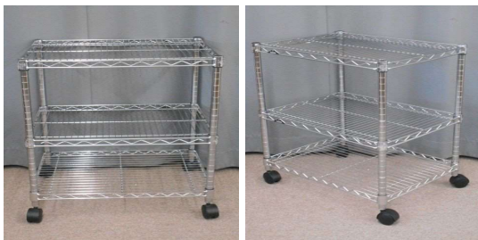
メタルラック(3段、キャスター付)