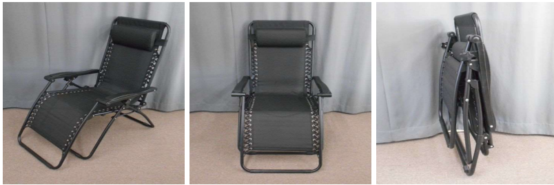
イス(折りたたみ式)