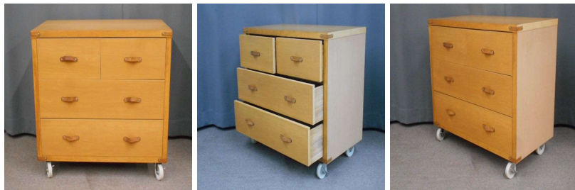
チェスト(3段、キャスター付)