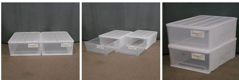
引出し式収納ケー ス2個セット