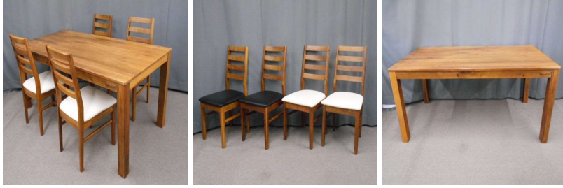
ダイニングテーブル イス4脚セット