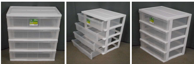
引出し式収納ケース(4段)