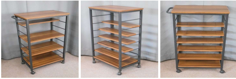
棚(5段、キャスター付)