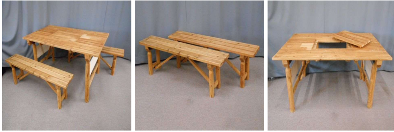
テーブル ベンチ2脚セット