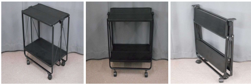
ワゴン(キャスター付、折りたたみ式)