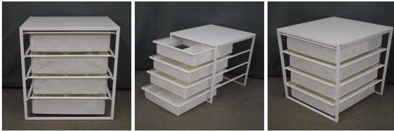
収納ラック(4段、布製)