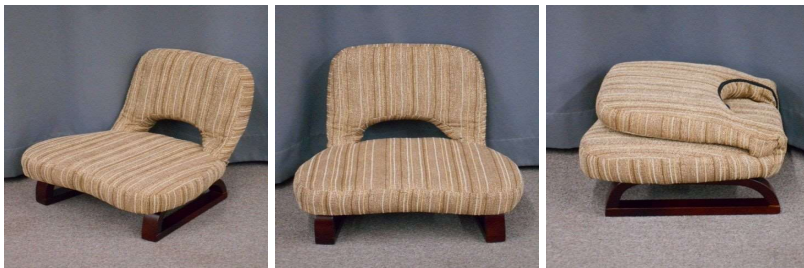
座イス(折りたたみ 式)