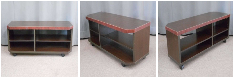
台(3段、キャスター付)