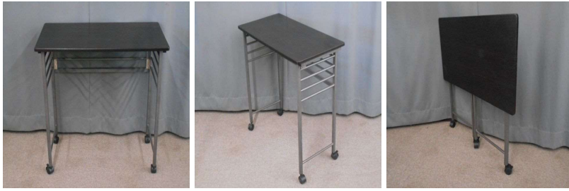
テーブル(キャスター付、折りたたみ式)