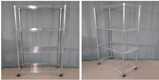
メタルラック(4段、キャスター付)