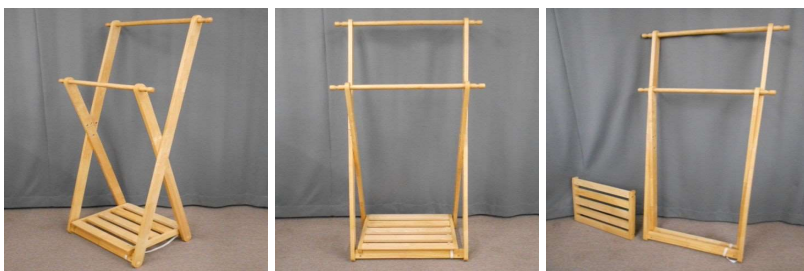
洋服掛け(折りたたみ式)