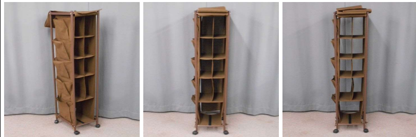
収納ラック(5段、 布製、キャスター 付)