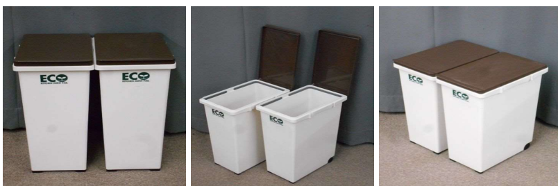
ごみ箱2個セット (キャスター付)