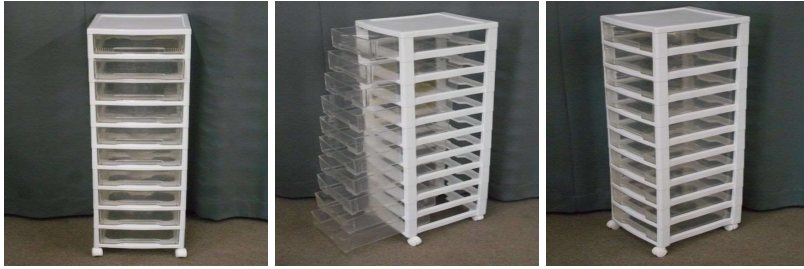
クリアケース(10段、キャスター付)