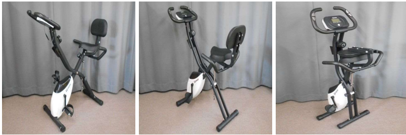
健康器具(折りた たみ式)