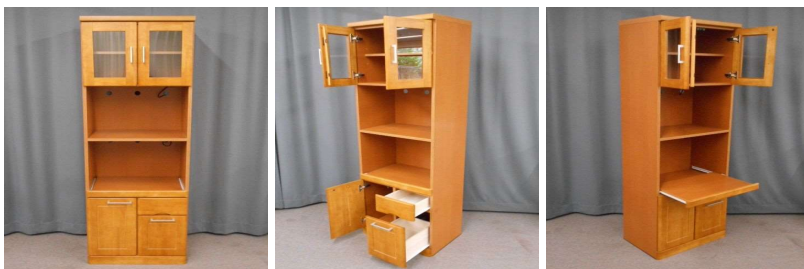
キッチンラック(6段、コンセント付)