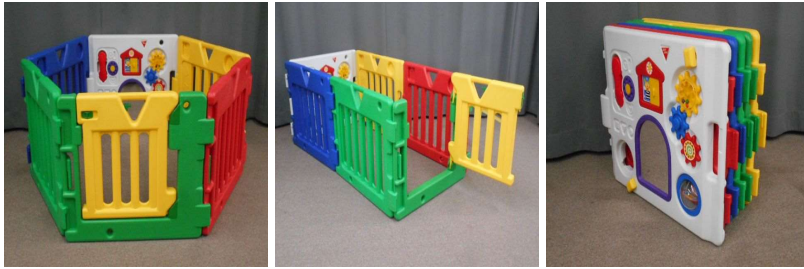
ベビーサークル (折りたたみ式)