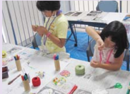
今年も大盛況！子どもたちの熱心な仕事ぶりに脱帽。 (エコットキッズタウン)