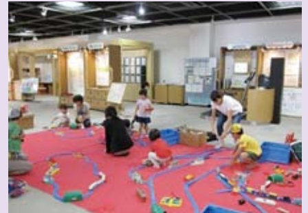
列車のおもちゃで、ちびっこもクールシェア！ (ちびっこレールパーク)

豊田市では、みなさんの夏の思い出(クールシェア)を募集中(～9/30)。とよたエコポイント100Pがもらえるよ♪