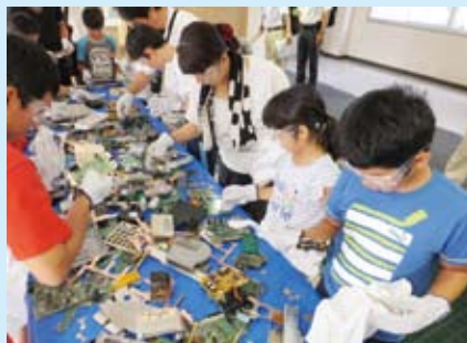
小型家電の中には貴重な金属がいっぱい！リサイクル体験しました。