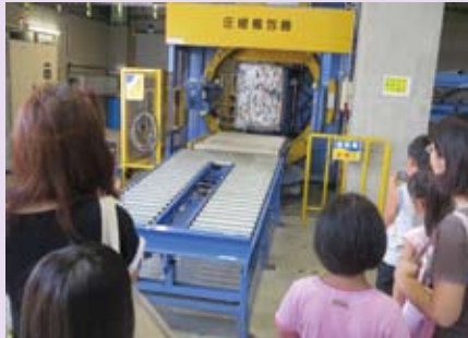
「ごみを減らすためにきちんと分別することが大切。」見学を通して実感！ (ごみのゆくえを見に行こう～特別コース～)

暑かった今年の夏は、昨年よりもたくさんの来館者でにぎわいました。涼しいeco-Tで楽しく学んでもらえたかな？