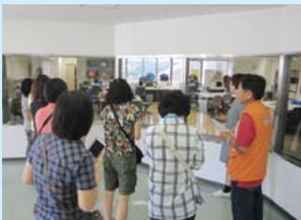
環境学習に取り組む団体の方々が、韓国から来館。お互いに情報交換もしました。